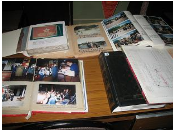
Альбомы с фотографиями