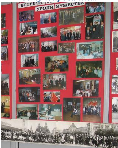
Стенды с фотографиями