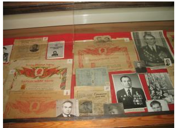
Витрина с грамотами, благодарностями