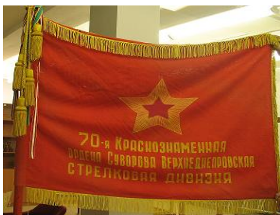
Боевое знамя дивизии