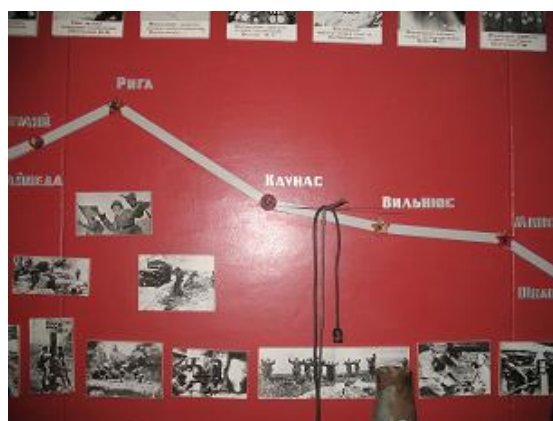
Боевой путь дивизии