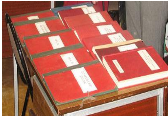
Воспоминания ветеранов 70-й стр. див.