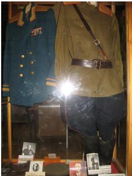
Витрина с военным обмундированием